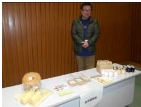
後閑養鶏園ブース展示