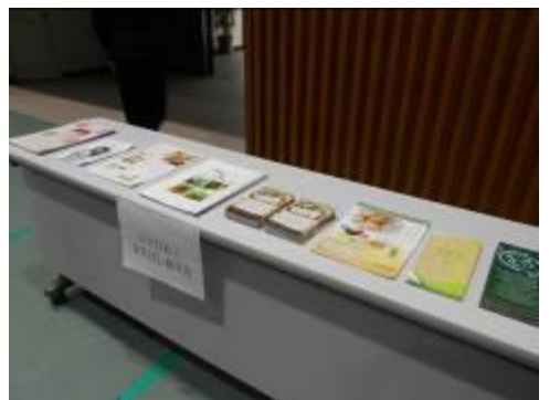
NPO法人まえばし農学舎 ブース展示