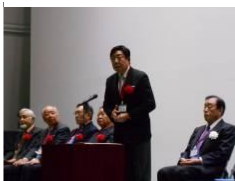
前橋市長 山本 龍 様挨拶