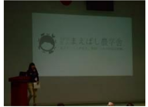
発表者:NPOキッズバレイ 代表 星野麻美様 発表者:エコツーリズム推進協議会丸山峰樹様 発表者:NPOまえばし農学舎黛 若葉様