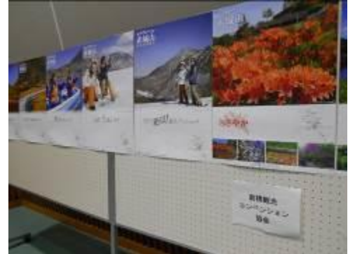
前橋観光コンベンション協会ブース展示