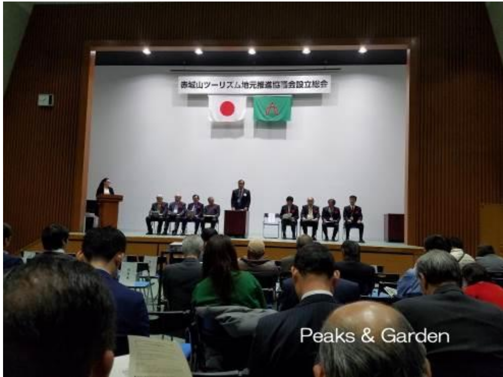
12:30 受付開始、会場風景

会場／国立赤城青少年交流の家 前橋市富士見町赤城山27 Tel027-289-7224 日時 2017.3.23(木) 12:30～16:00 (総会議事13:30～15:37) 主催 NPO 法人赤城自然塾 参加者 140名