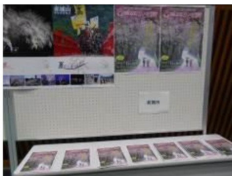
前橋市ブース展示